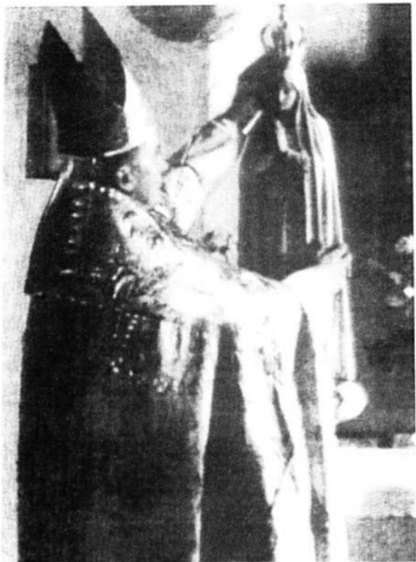
Kardinal Stepinac kruni kip Gospe Fatimske u zatočeništvu u Krašiću 1959. Kip mu je poslao Papa Pija XII